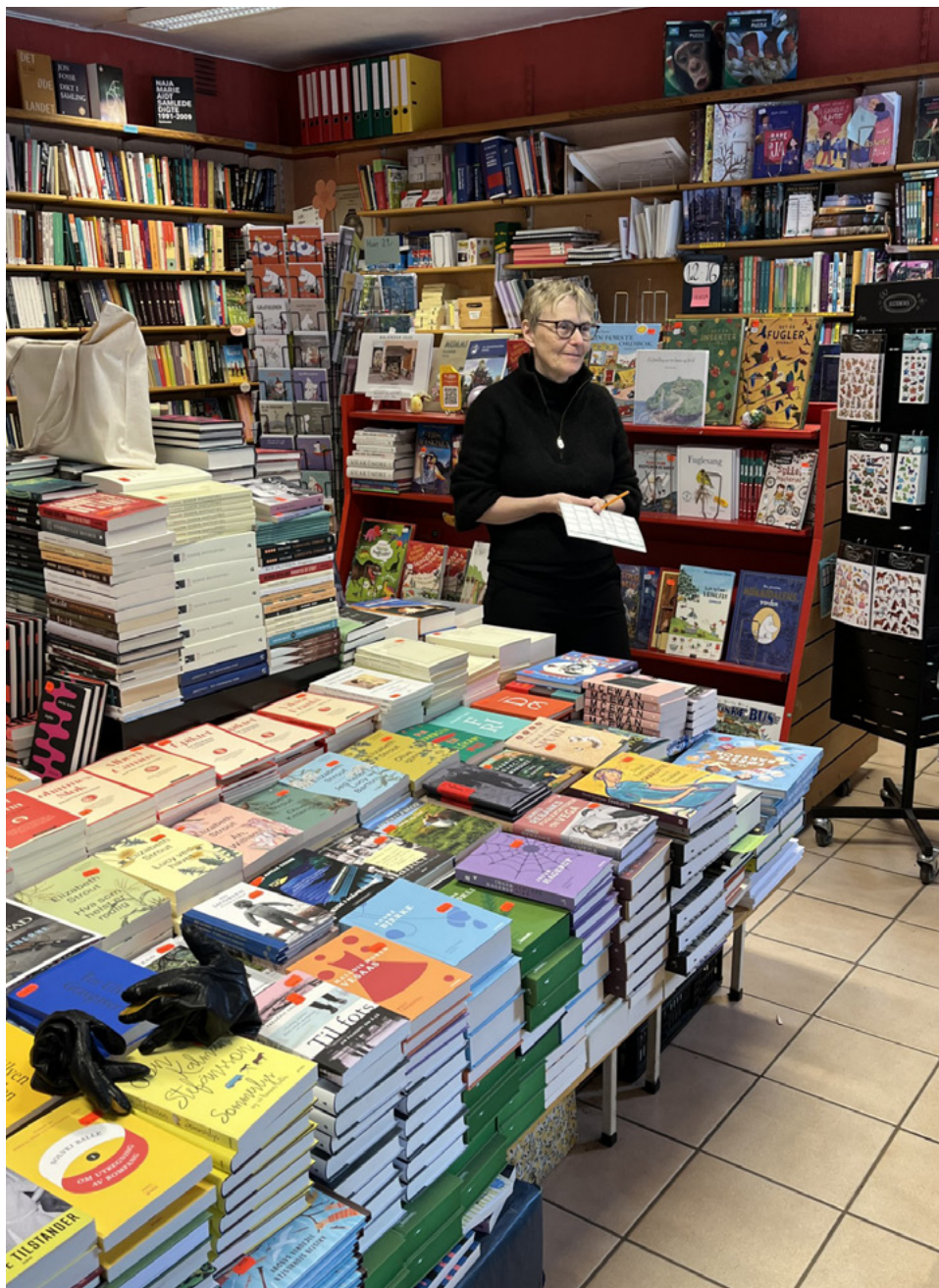
Tulla i Bislet Bok.