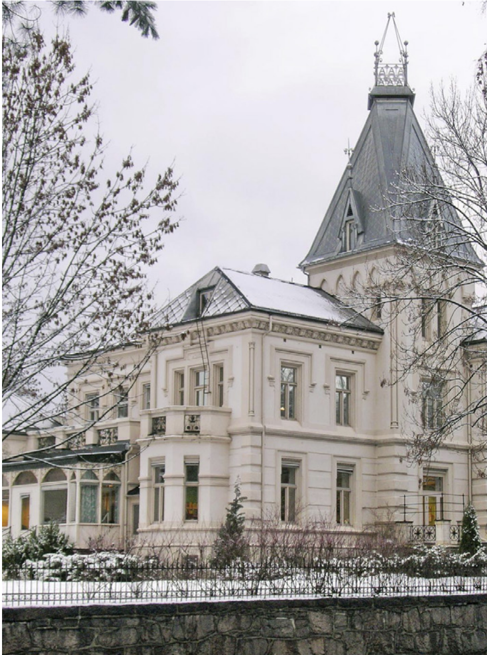
Ringnesvillaen sett fra hagen.