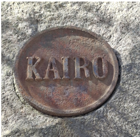
Kobberplate på portstolpen.

mer å bygge. I tillegg tegnet de ofte møbler, gull- og sølvsmykker og innredning som for eksempel lamper.