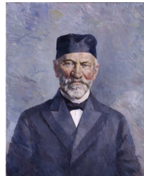
Maleri av Ellef Ringnes, utført av Hans Ødegaard ca. 1900.

også under navnet Barcelona, husfruen lå jo i barsel hele 14 ganger!