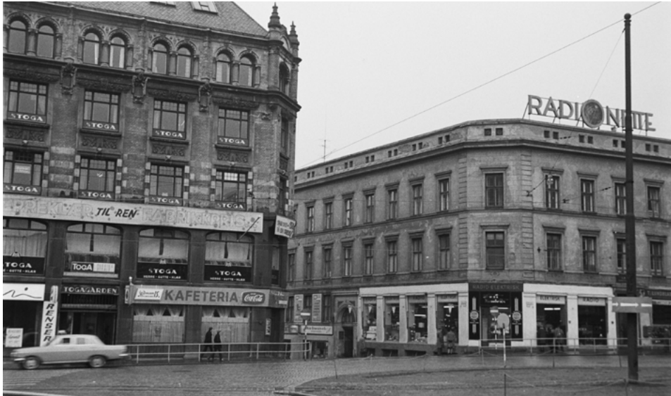
Theatergata 1 og 2 (1966)

misk støtte fra staten startet han privat opplæring av døve. Denne opplæringen kom til å sette preg på døveundervisningen i Norge fram til 1880-årene. Da hadde skolen for lengst flyttet til andre lokaler på Schafteløkken. Videre holdt Brødrene Hals' pianofabrikk til i en egen bygning inne i den store bakgården. Fra 1909 hadde Kristiania Kooperative Selskab butikk på hjørnet Teatergata/Akersgata, den ble flyttet hit fra Teatergata 2, der den hadde vært siden 1900.