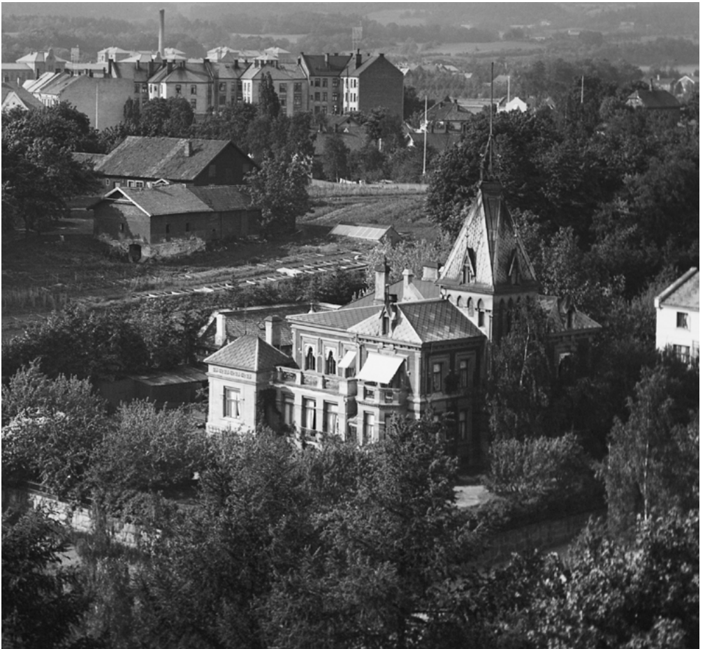
«Villa Kairo» – Ringnesvillan.