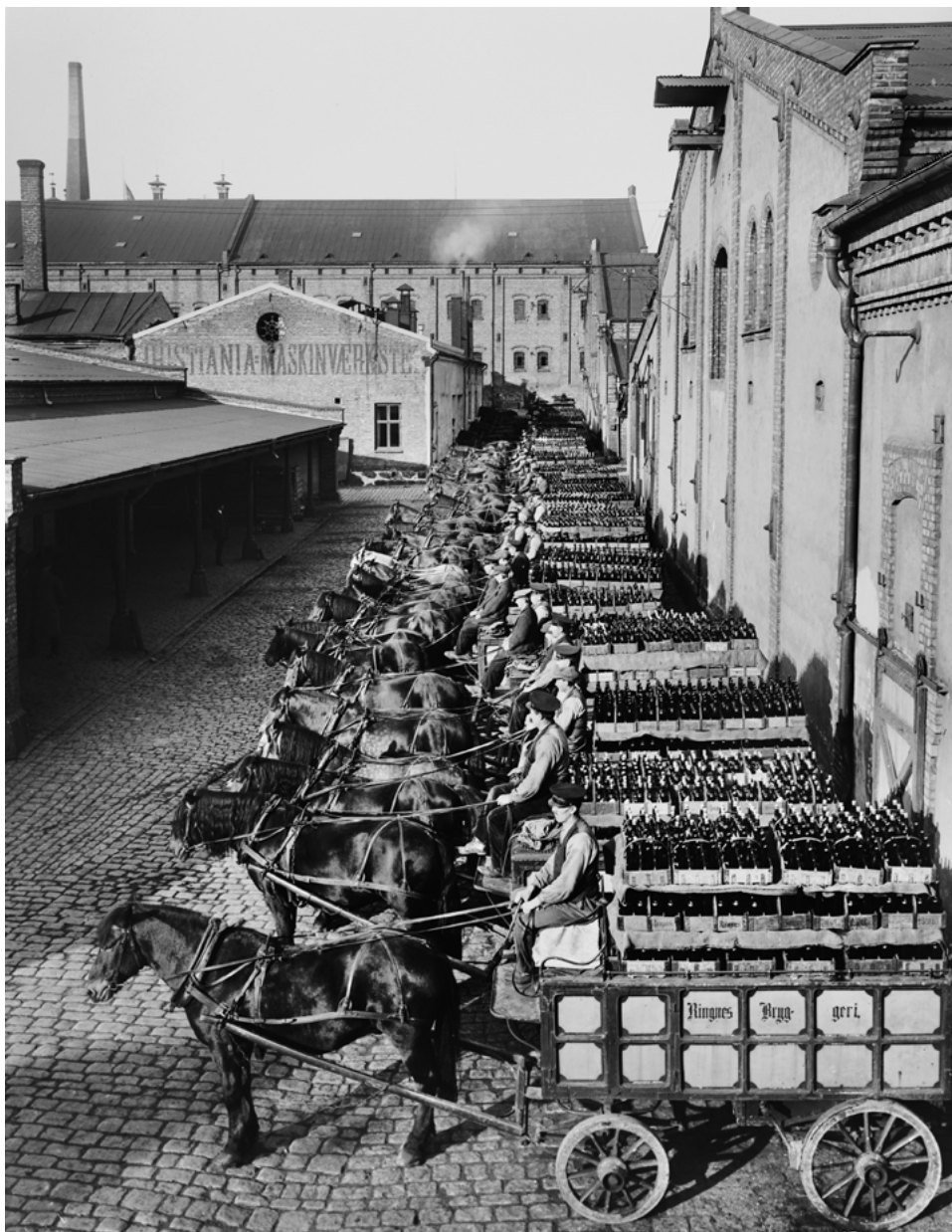
Bryggerihester og ølvogner ved Ringnes bryggeri.