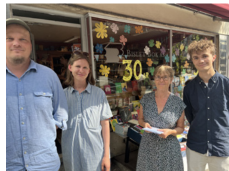
Bislet Bok markerer sitt 30-års jubileum i 2023.