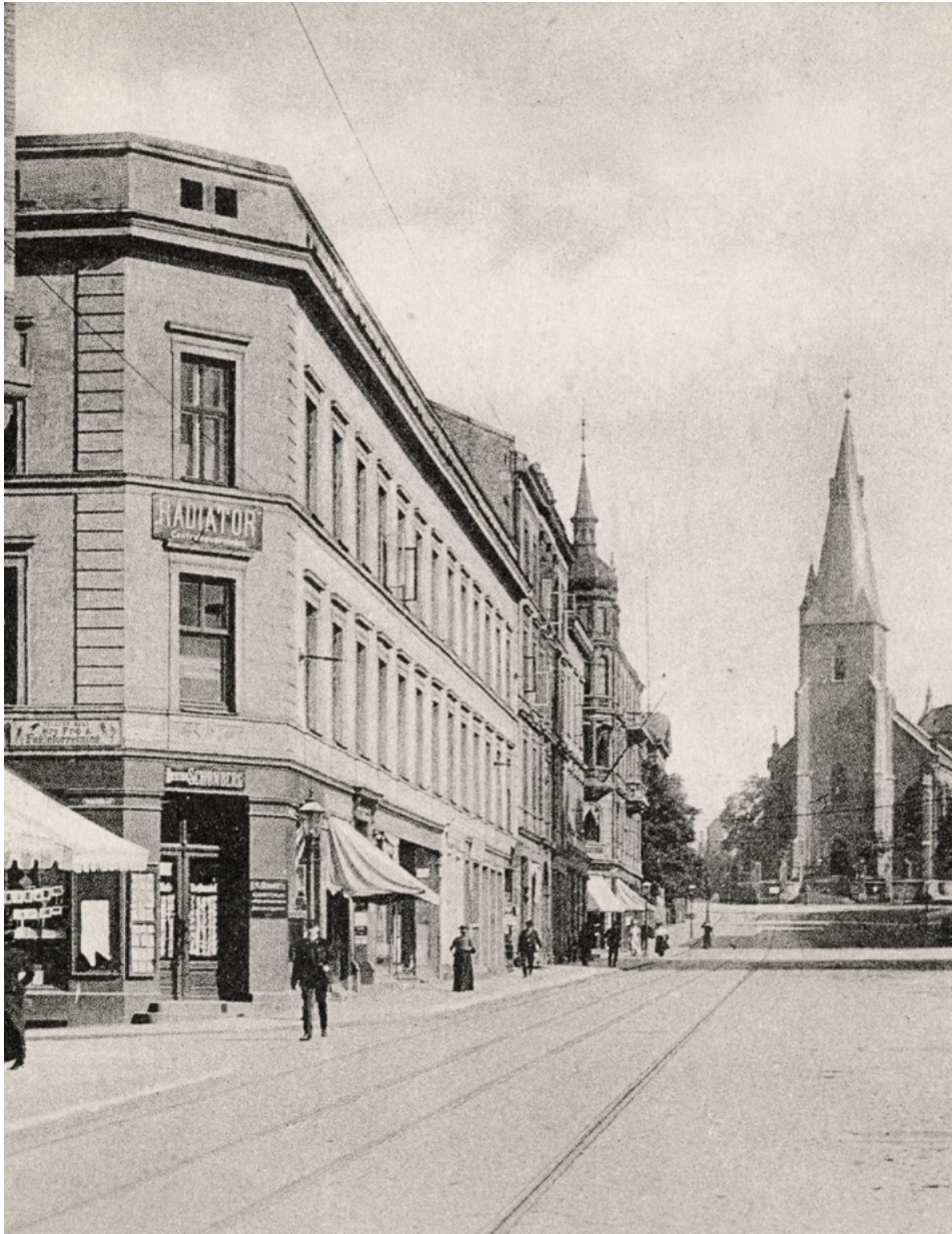
Theatergata 1 ved Akersgata.