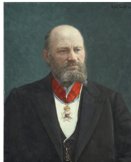
Maleri av Amund Ringnes, utført av Eyolf Soot ca. 1900.